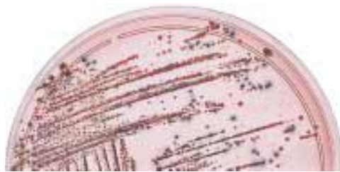
Хромогенная среда SM ID : розовые колонии : Salmonella sp