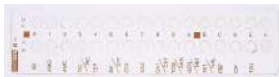
ATB G - : Salmonella sp