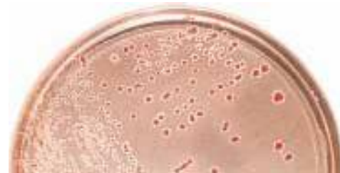
Селективная среда Yersinia CIN : Yersinia enterocolitica