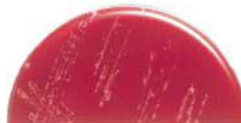
Агар Campylosel : Campylobacter jejuni