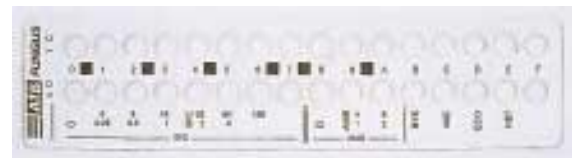
ATB FUNGUS : Candida albicans