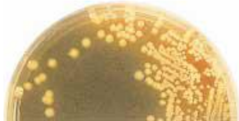
Агар Гектоен : Shigella sonnei