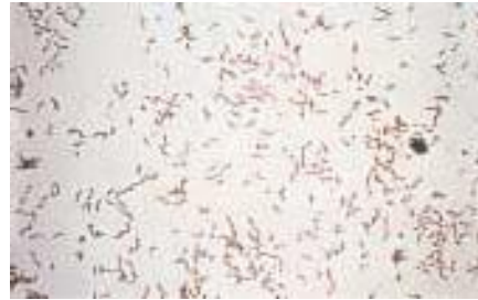
Color Gram 2 : Campylobacter jejuni

МЕТОДЫ С ИСПОЛЬЗОВАНИЕМ ПРИБОРА АТБ-ЭКСПРЕССЬОН